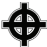
3. Keltský kríž