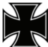
18. Železný kríž