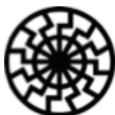
19. Čierne slinko