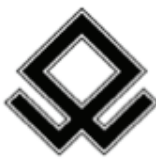
4. Odal Rune