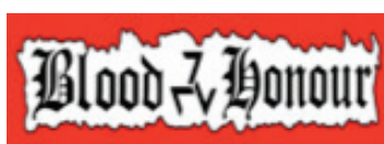
11. Blood and Honour