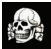
2. SS – Totenkopf