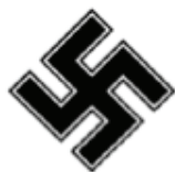
1. Hákový kríž.