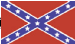
9. Juzánska vlajka